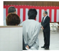
主催者挨拶（安全協力委員会委員長）