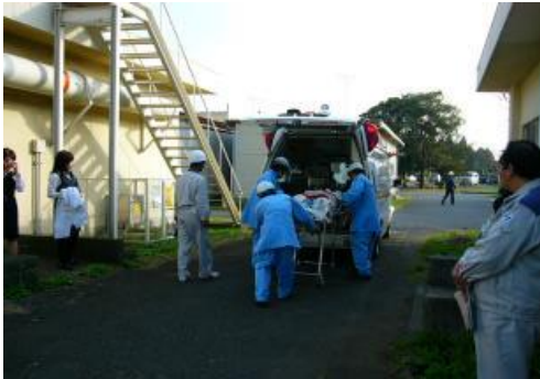
大洗町消防署と連携した負傷者の搬出訓練