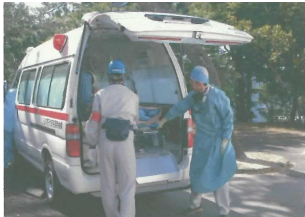
負傷者搬出の様子