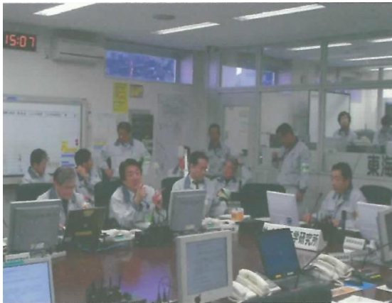
現地対策本部の様子