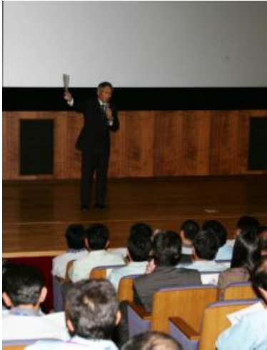
アトムワールド講堂で 行われた講演会の様子