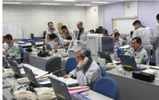
訓練中の現地対策本部の様子（